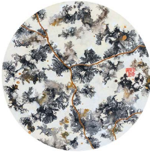
Kintsugi, 2023 Technique mixte sur bois