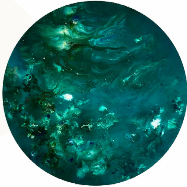
Planète VII, 2023 Technique mixte sur bois et résine