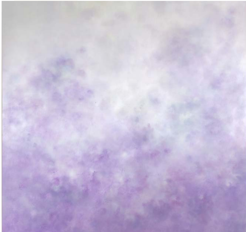
Sans titre Technique mixte sur toile