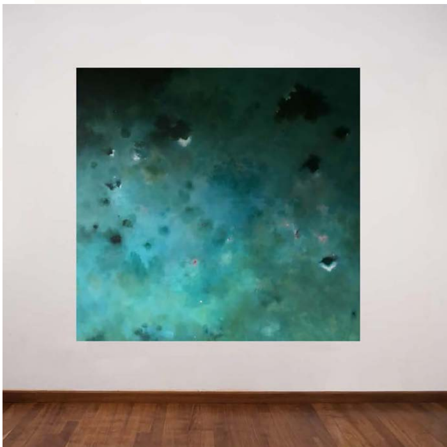
Danaé, 2020 Technique mixte sur toile