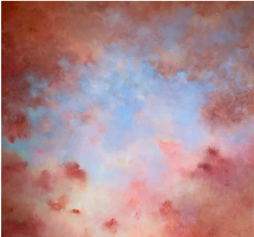
After the Storm, 2023 Acrylique sur toile