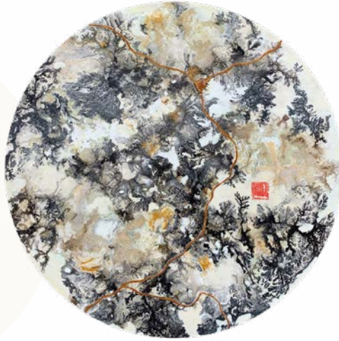
Kintsugi, 2023 Technique mixte sur bois