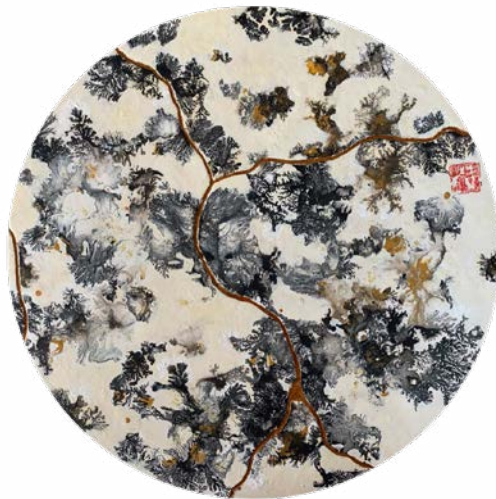
Kintsugi, 2023 Technique mixte sur bois