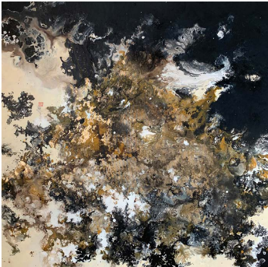
Those who are only looking for gold will never find the Secret, 2023 Technique mixte sur toile