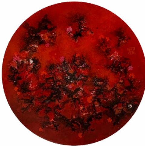
Ikebana II, 2023 Technique mixte sur bois et résine