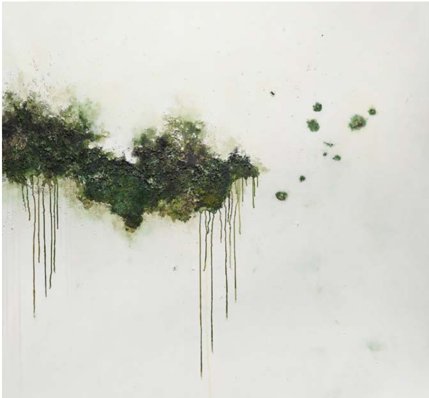
Sans titre Technique mixte sur toile