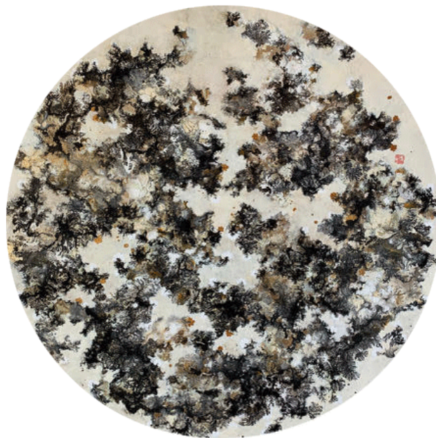
Golden Ikebana, 2023 Technique mixte sur bois

Diam. 99,5 cm Encerclée ferronnier d'art 3000 EUR