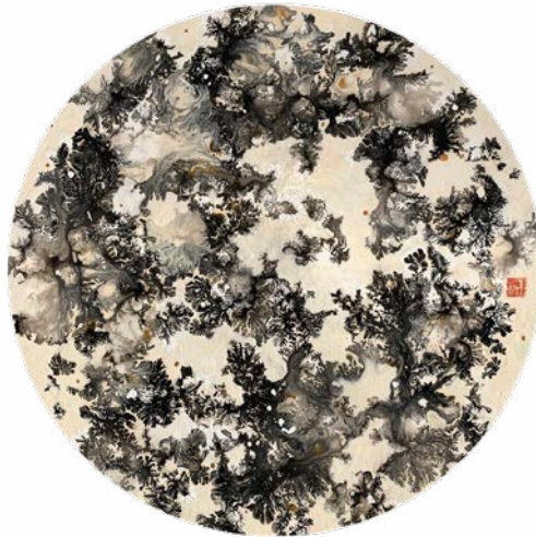
Elégie XII, 2023 Technique mixte sur bois