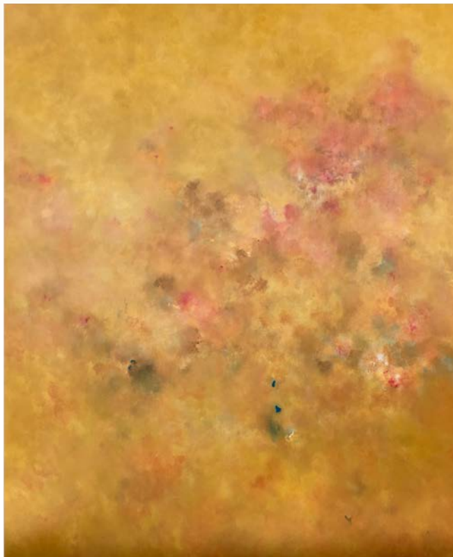
Sans titre Technique mixte sur toile